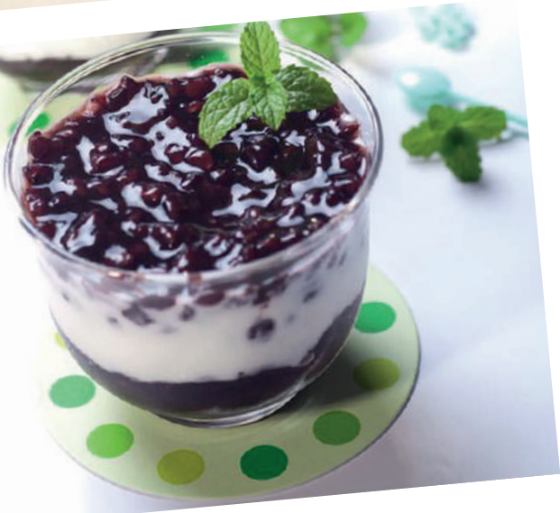
233. Sữa Chua nếp cẩm

Vietnamesische schwarzer Klebereis, frische Mango, Mango-soße verfeinert mit Joghurt, Kokosmilch und Sesam Yogurt Black Sticky Rice Pudding is a beloved dessert of people of all ages in Vietnam. The tartness of yogurt combining with the light sweetness and richness of soft-chewy black sticky rice can cool you down quickly on hot summer days: yogurt, coconut milk, crushed ice.